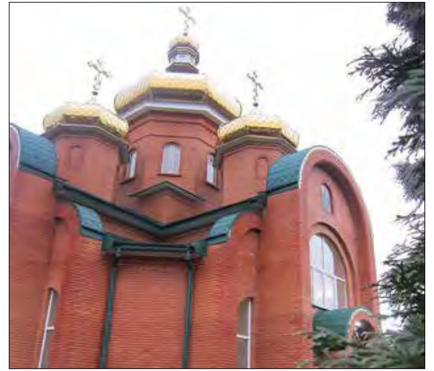
Перший український храм у Смілі.

Митрополит Епіфаній виголосив проповідь, в якій розповів про важливість храму в житті християнина і відзначив церковними нагородами настоятеля та благодійників храму. Народний хор „Заграва“ заспівав предстоятелю „Многая літа“ і „Боже, великий, єдиний нам Україну храни“.