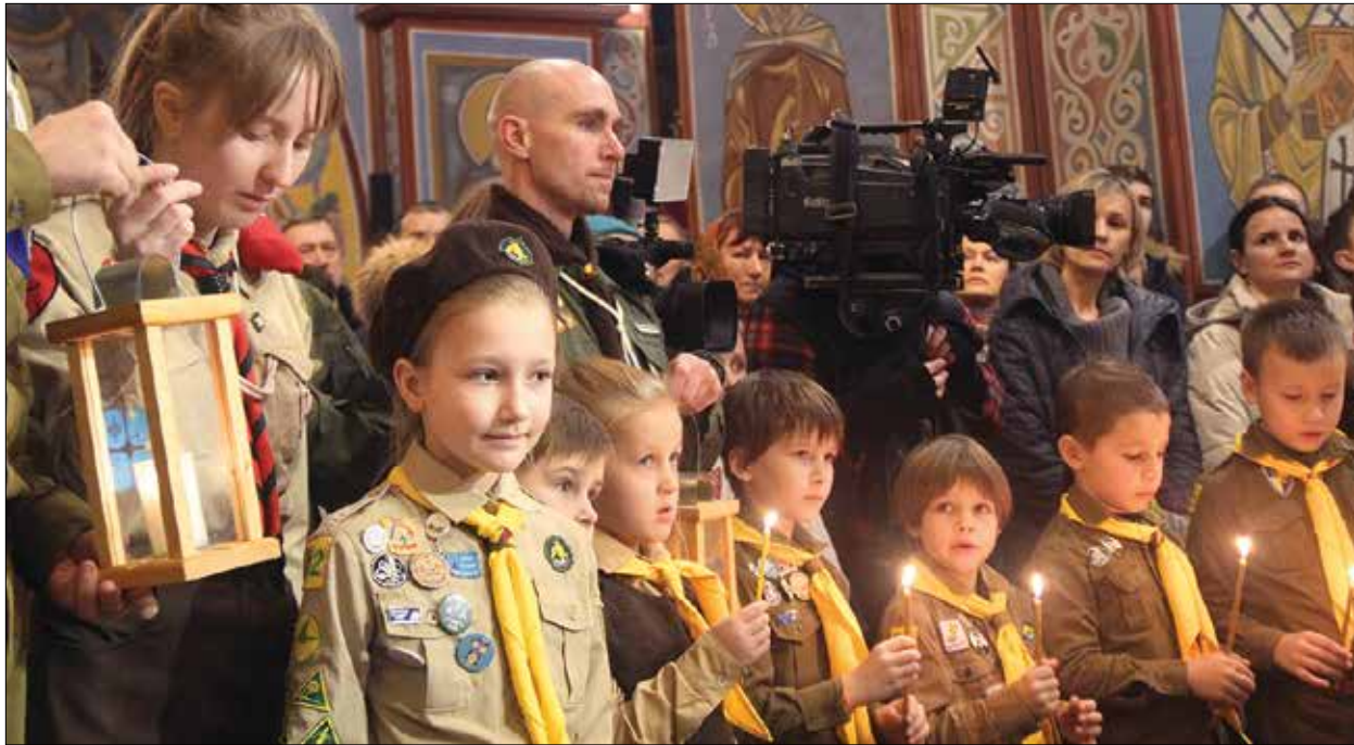
Маленькі пластуни під час передання Вифлеємського вогню до Михайлівського Золотоверхого собору.