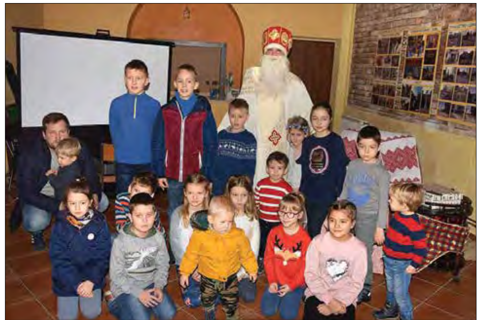
Учасники зустрічі з св. Миколаєм.