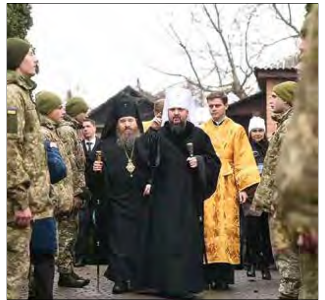
Митрополита Епіфанія зустрічає почесна варта воїнів Збройних Сил України.

А священника-капеляна знову покликана війна. 24 грудня, напередодні Різдва, о. М. Шевчук поїхав у Широкине і Мар'їнку, де на нього, свого побратима і сповідника, чекали воїни.