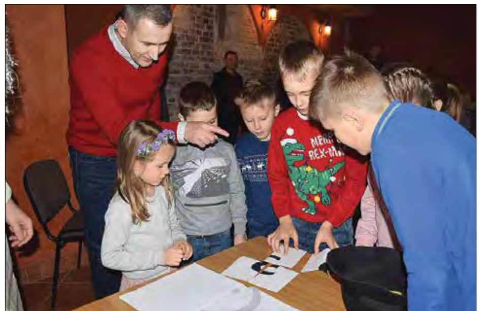
Діти у Зеленій Гурі відгадують чарівне гасло.