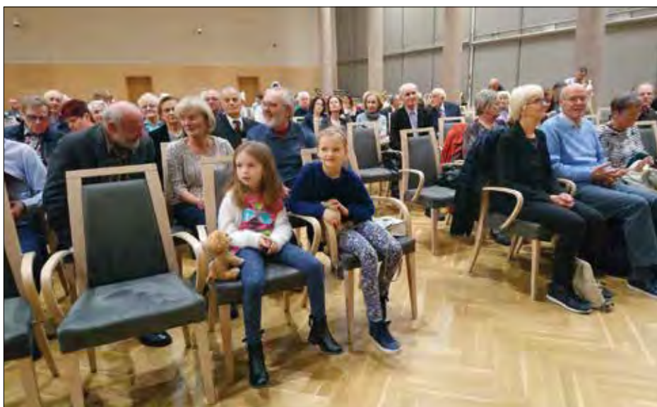
Учасники XVI днів української культури.