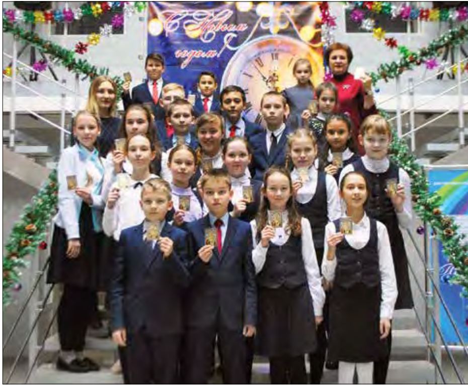
Діти Татарстану з іконочками св. Миколая.