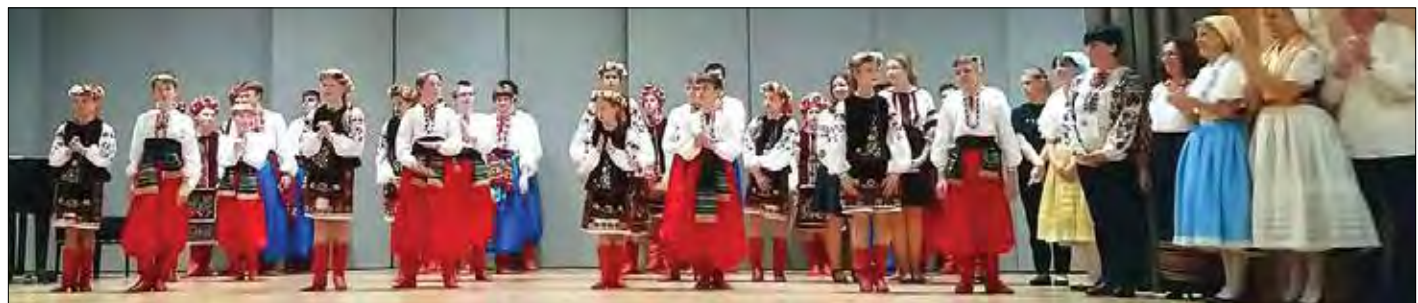
Концерт в Колонній залі Маршалківського уряду Любуського воєводства.

Об'єднання Лемків, які запрошують всіх до своєї домівки. Є бібліотека з немалою кількістю українських книжок. Діють дві церкви – Українська Греко-Католицька Церква і Автокефальна Православна.