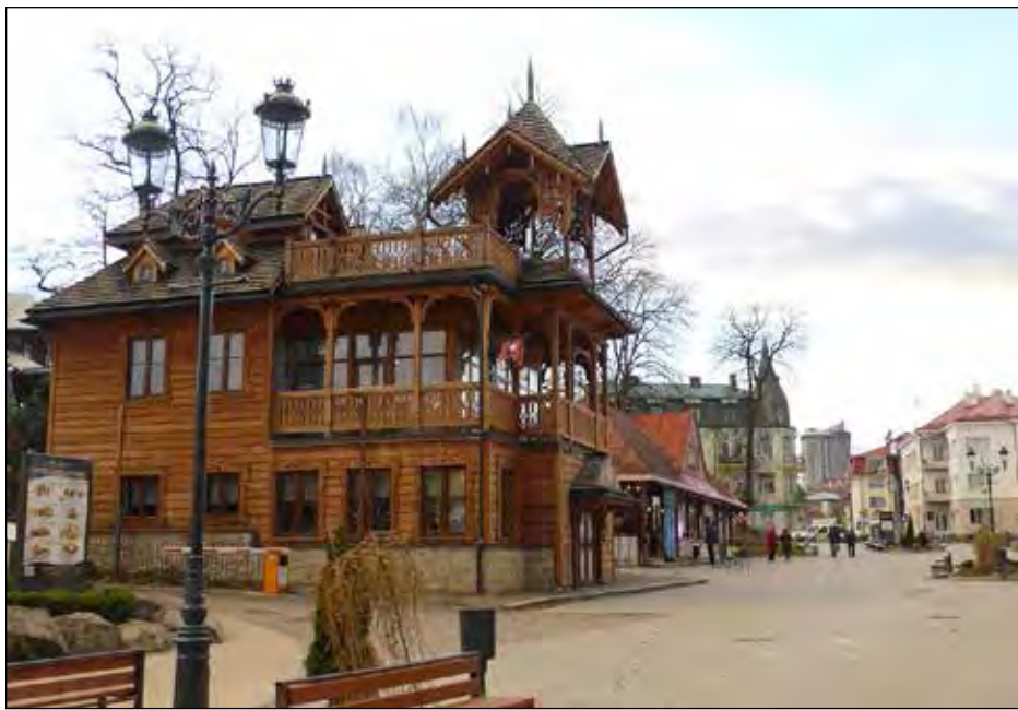
Львівська майстерня шоколади в Трускавці.