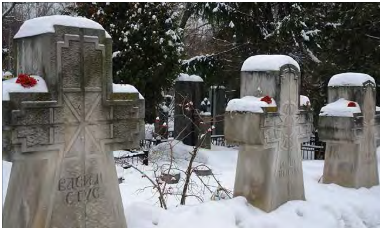
Поховання лицарів українського духу на Байковому цвинтарі Києва.

На вечорі кожен охочий міг підписати різдвяну листівку, яку організатори акції обіцяли відправити до місць утримання українців та полонених моряків. Як наголосив керівник Українського інституту національної пам'яті В. В'ятрович, за ґратами у Росії Різдво зустріли близько 70 політв'язнів та 24 військовополонені українські моряки, ще понад 100 осіб перебувають у підвалах окупованого Кремлем Донбасу.