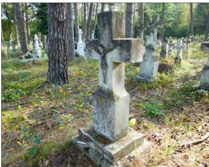
Старовинне греко-католицьке кладовище в Горайці.

Цвинтар у Горайці з характерними білими вапняними хрестами становить цілісний елемент краєвиду любачівської землі. Ліс, у якому знаходиться це виняткове кладовище, додає цьому місцю чарівності, таємничості і магії.