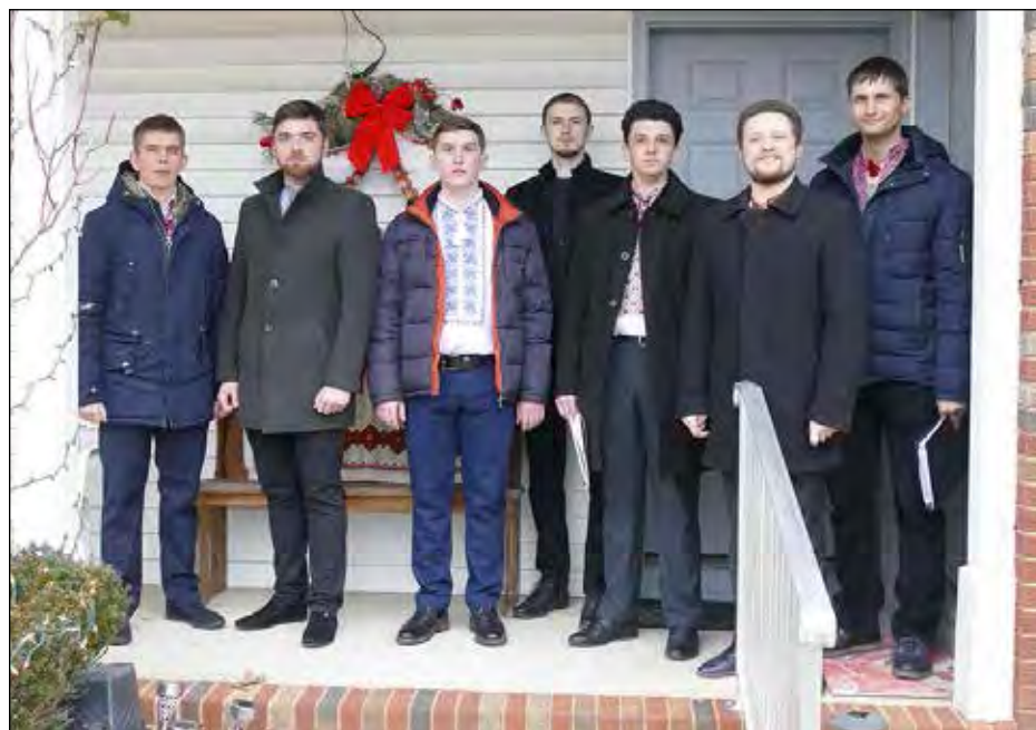
Хор Семінарії св. Софії Української Православної Церкви США.