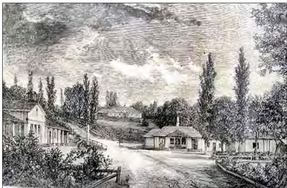
Олександр Тітц. Центр Трускавця (1854 рік).