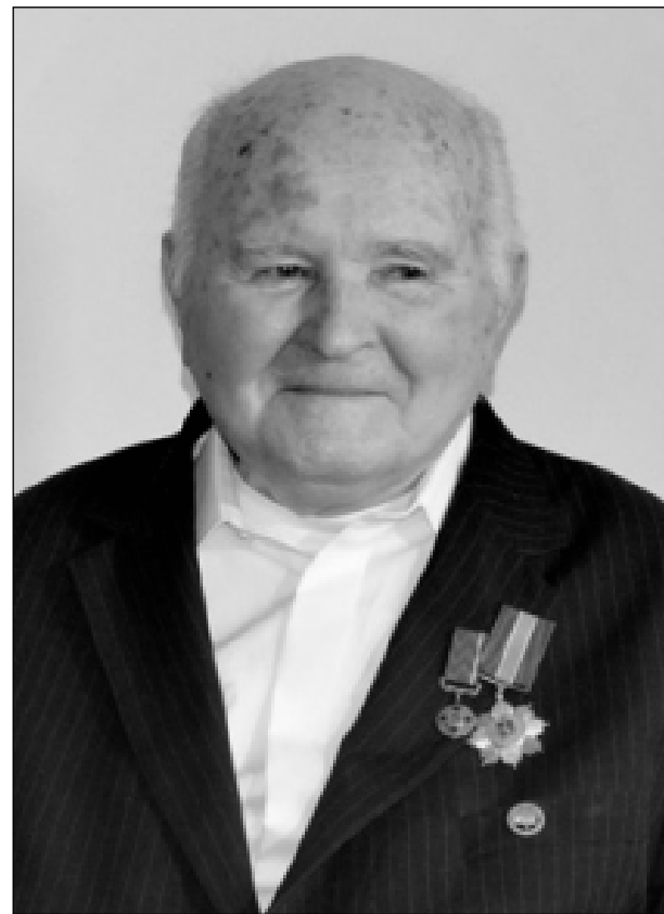
Стефан Романів, голова ОУН

Похоронні відправи відбулися у Львові 23 січня на Личаківському цвинтарі.