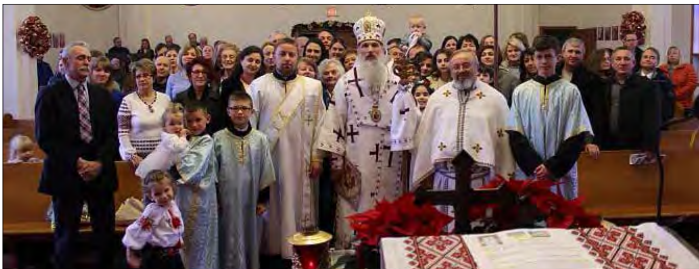
Учасники свята в парафії Української католицької церкви Різдва Діви Марії.

Владика Венедикт взяв участь у Літургії і виступив з промовою про важливу місію кожної людини на землі та Ісуса Христа як світла, яке