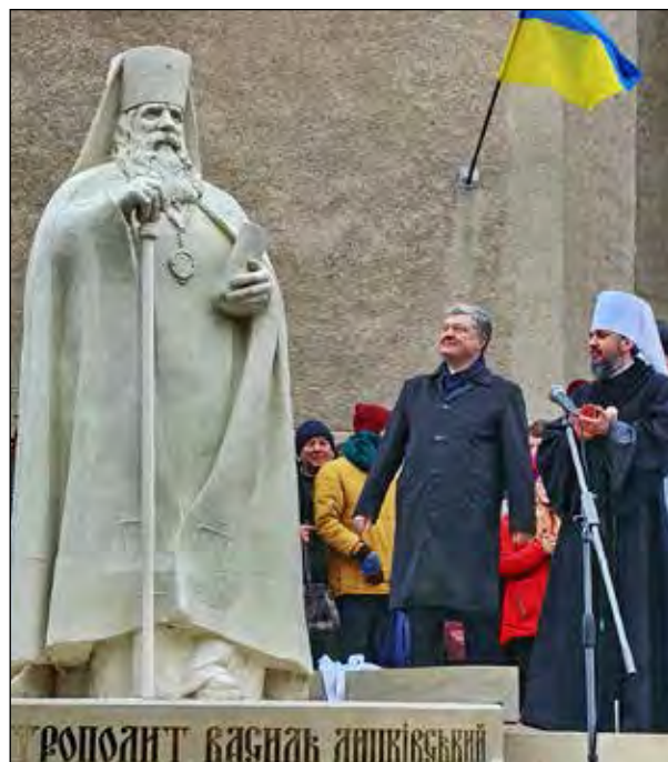
Відкриття пам'ятника Митрополитові Василеві Липківському в Черкасах.