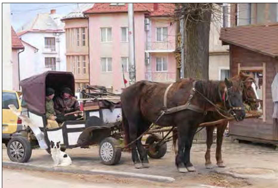
В чеканні на пасажирів в Трускавці.