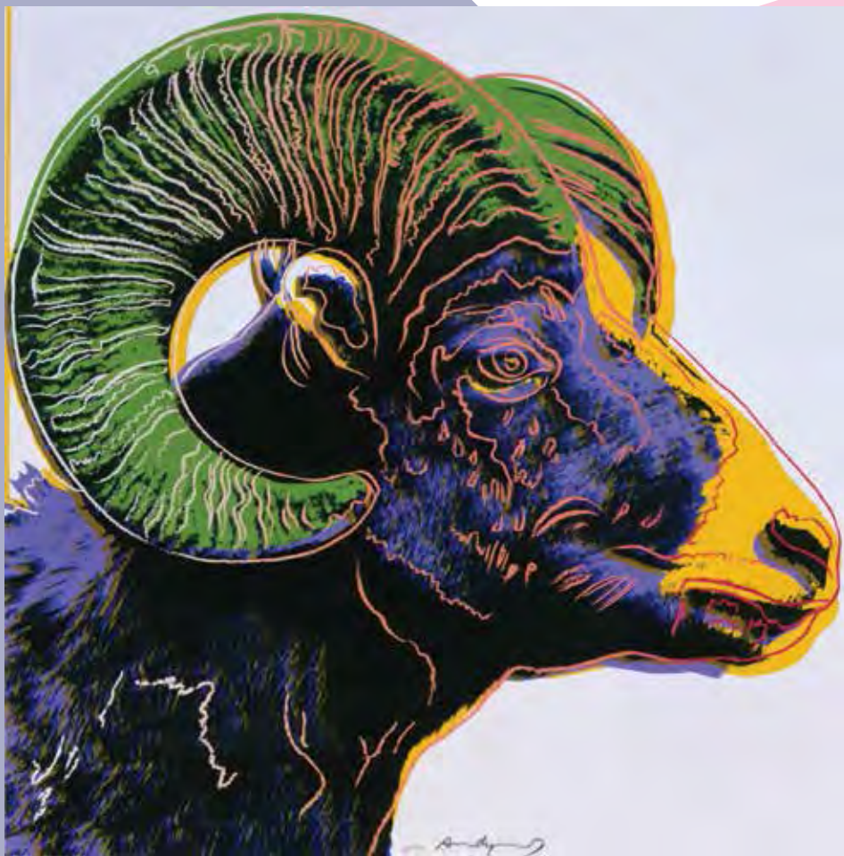
Andy Warhol, Bighorn Ram from the Andy Warhol: Endangered Species (1983), on loan from the National Museum of Wildlife Art, Wyoming.