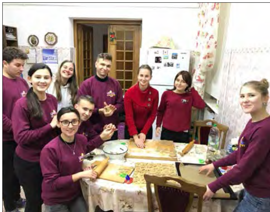
Учасники майстер-кляси для християнських англійськомовних аніматорів.