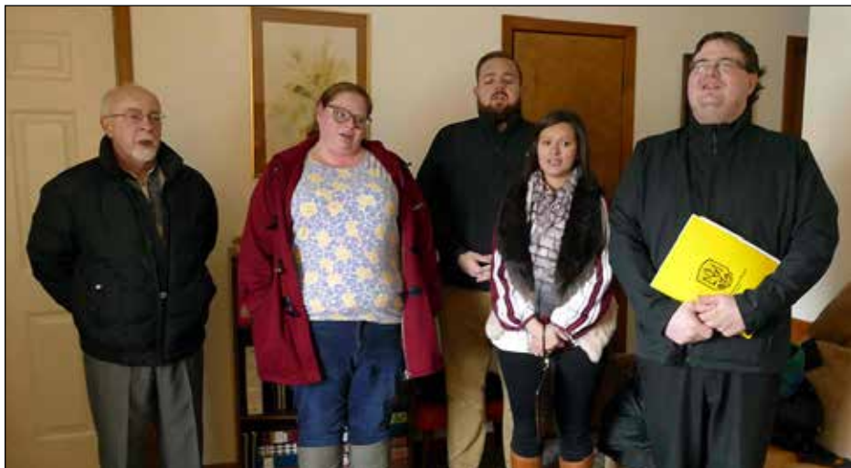
Осередок Спілки Української Молоді в Ірвінгтоні, Нью-Джерзі.

СОМЕРСЕТ, Нью-Джерзі. – 19 січня в „Українському селі“ зустрічали гостей. З колядою і віншуванням прийшли численні групи дітей, молоді і дорослих. Нижче вміщено фотографії Левка Хмельковського з цих відвідувань.