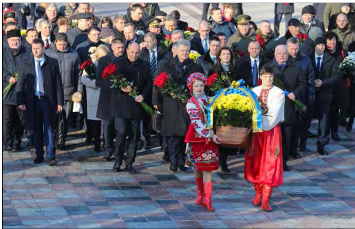
Під час церемонії покладання квітів до пам'ятника Михайлові Грушевському.

КИЇВ. – Президент України Петро Порошенко разом з дружиною Мариною взяв участь у церемонії покладання квітів до пам'ятників великому українському поетові Тарасові Шевченкові і видатному державному діячеві Михайлові Грушевському з нагоди Дня