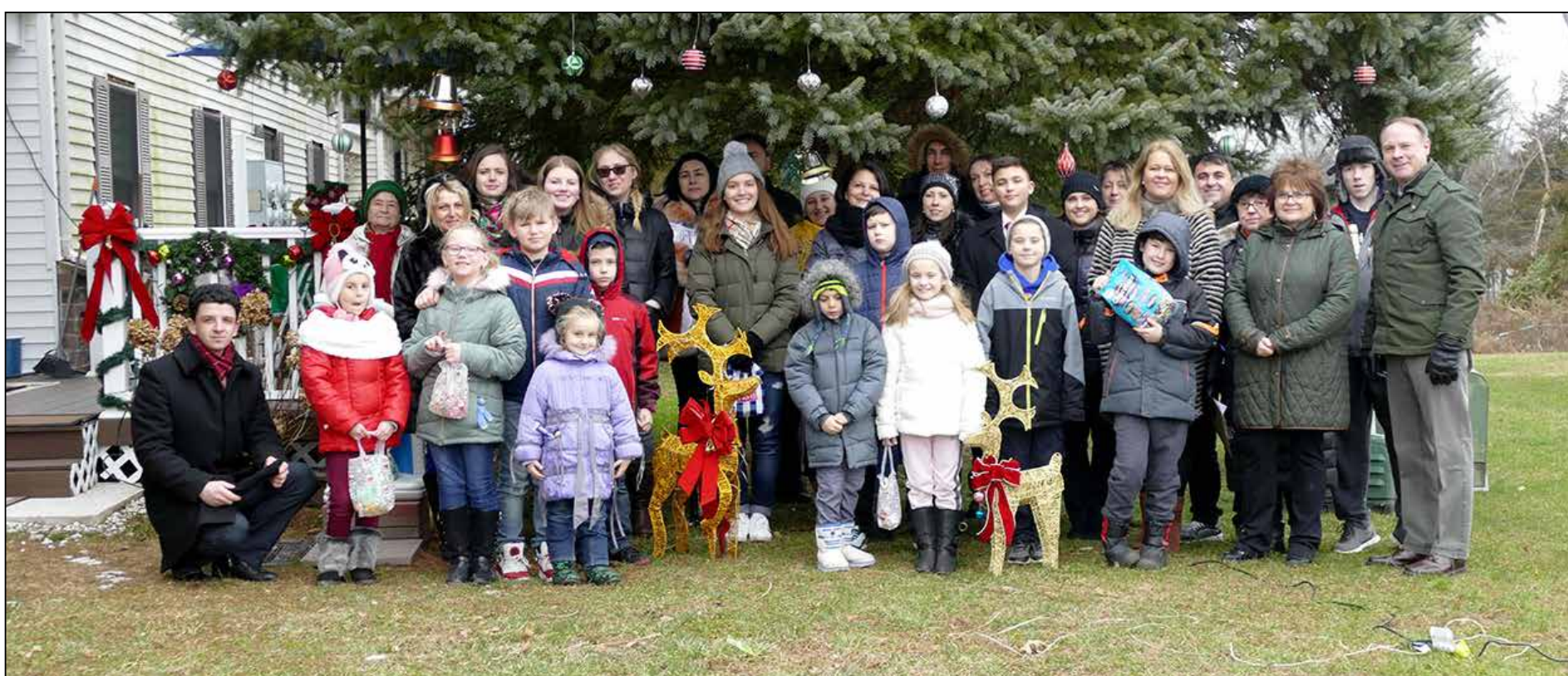
Школа при Українській православній церкві св. Андрія Первозваного.