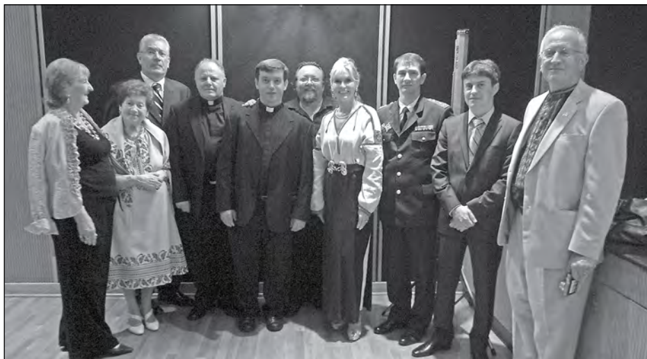
Учасники свята у Філядельфії.