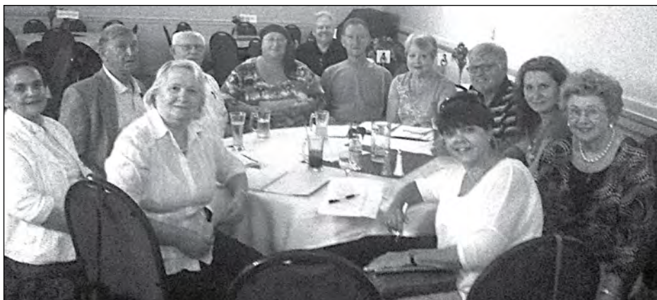
Члени Громадського комітету в Дітройті.