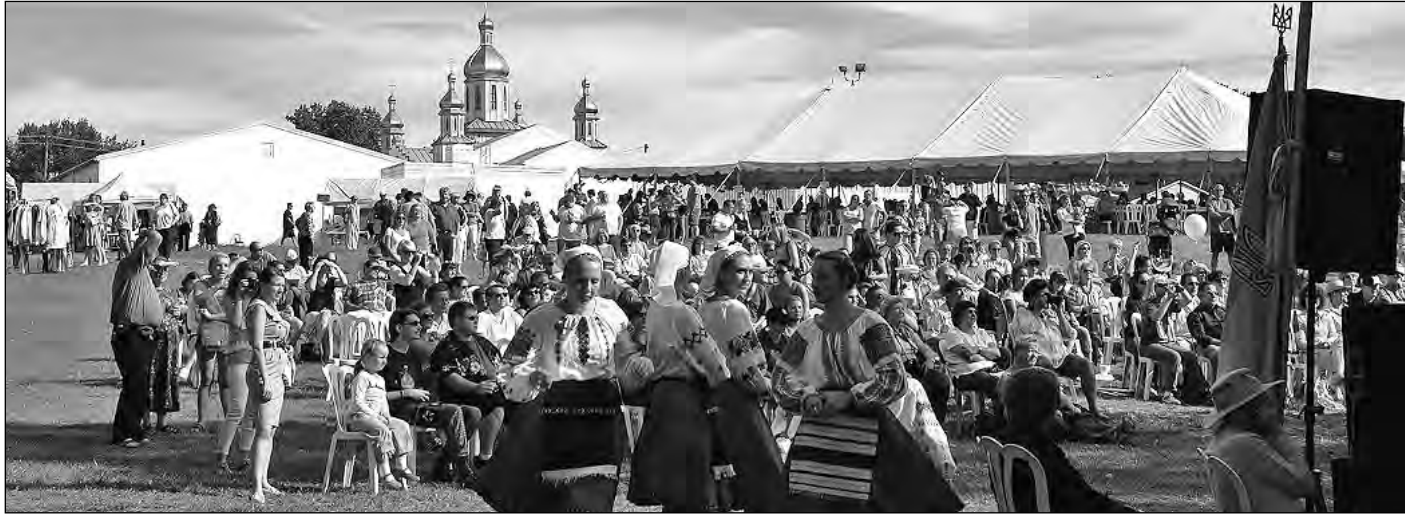
На 10-му фестивалі української культури.

Гості фестивалю ласувати стравами української кухні, купували вироби українського народного ремесла та образотворчого мистецтва.