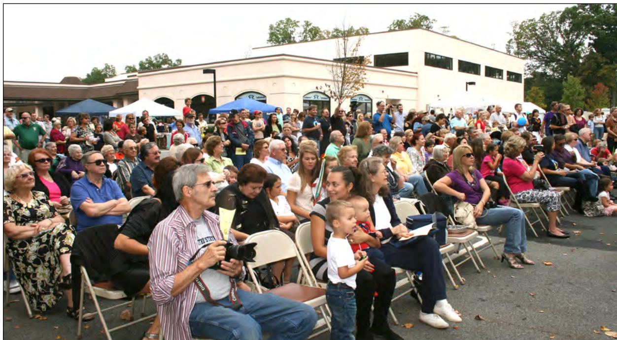
Гості фестивалю під час концерту.