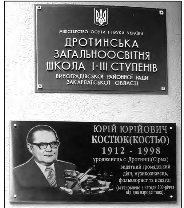
Меморіальна дошка в пам'ять видатного музичного діяча.