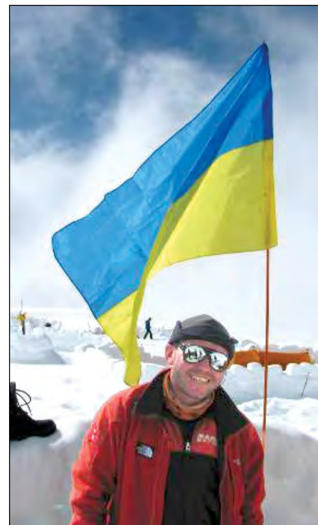
Прапор України у сніговому таборі.