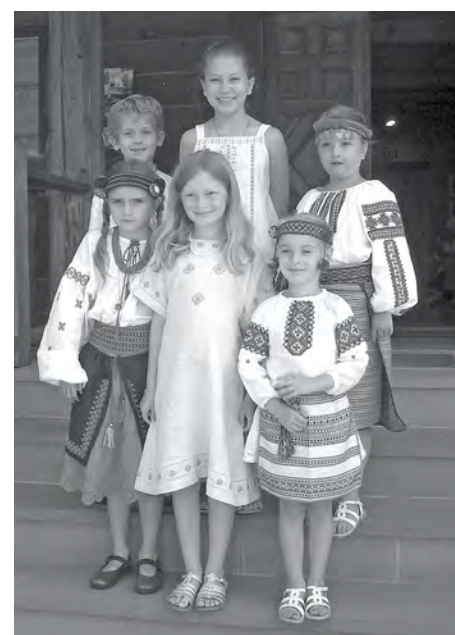
Маленькі учасниці свята в Гантері.