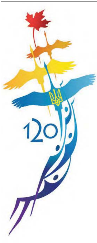
КУК Офіційний логотип 120-річчя.