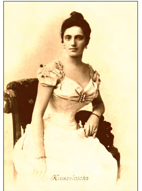
Соломія Крушельницька на давній картині.

Завершився вечір, як і почався, пісню у виконанні С. Крушельницької. Прозвучав останній запис геніяльної виконавиці, зроблений з 8 по 16 квітня 1951 року в Львові спеціально для навчання студентів правильного виконання народних пісень. С. Крушельницькій тоді було 79 років, однак голос її звучав так же сильно, впевнено і красиво, як завжди. Вона співала українську народну пісню „Закувала зозуленька“ в обробці Андрія Штогаренка.