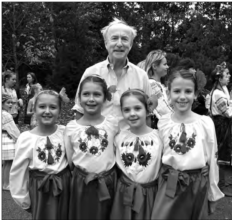
Конгресмен Родні Фремінггайзен з учасницями ансамблю „Солов'їний край”.

Фоторозповідь про фестиваль буде вміщено в наступному числі „Свободи”.