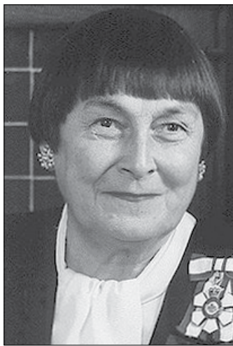
Св. п. Сільвія Федорук