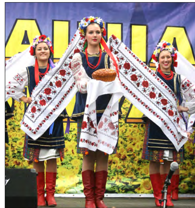
Танцюристки школи „Іскра“ відкрили фестиваль танцем „Привіт“.