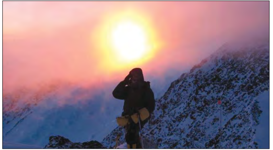
В горах сонце стає небезпечним.

Однак, шлях пролягав вже через довгий язик льодовика з де-не-де відкритими тріщинами і марковани-