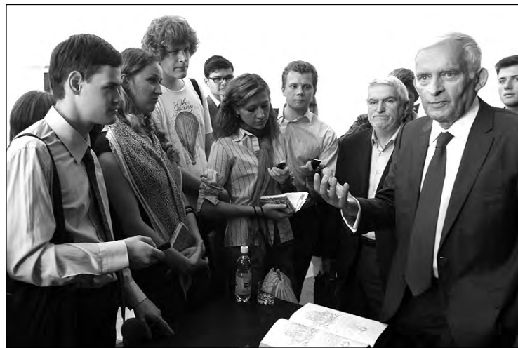
Єжи Бузек серед студентів Києво-Могилянської академії.

Звертаючись до студентів, Є. Бузек висловив переконання, що ключова роль у цьому процесі належить молодому поколінню, яке має широкі можливості розвитку та свободу вибору. На його думку, саме