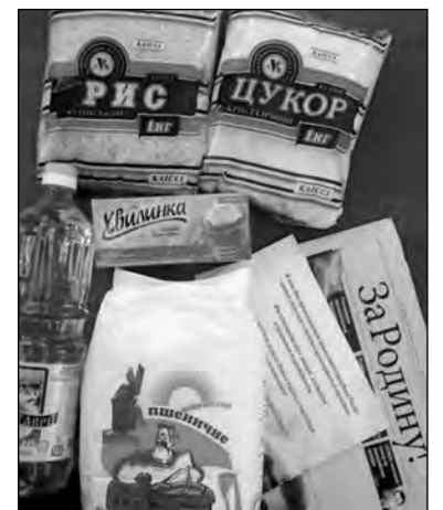
До подарованих харчів додано антиукраїнську агітацію.