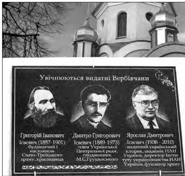
Меморіальна дошка на фасаді Вербської Свято-Михайлівської церкви.

На урочистостях Ісаєвичі ніби повернулися до свого рідного села.