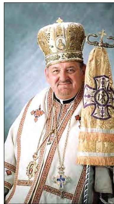
Св. п. Митрополит Константин

Митрополит Константин (Баган) народився 29 липня 1936 року в Пітсбургу, в сім'ї вихідців з України Станіслава й Катерини Баганів й був хрещений з