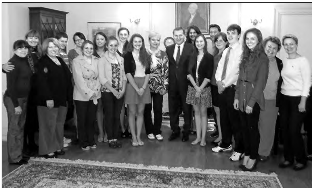
Учасники семінару під час зустрічі з Послом України в США Олександром Моциком.

Учасники семінару щиро подякували українським дипломатам за гостинність, завдяки якій семінар був успішним.