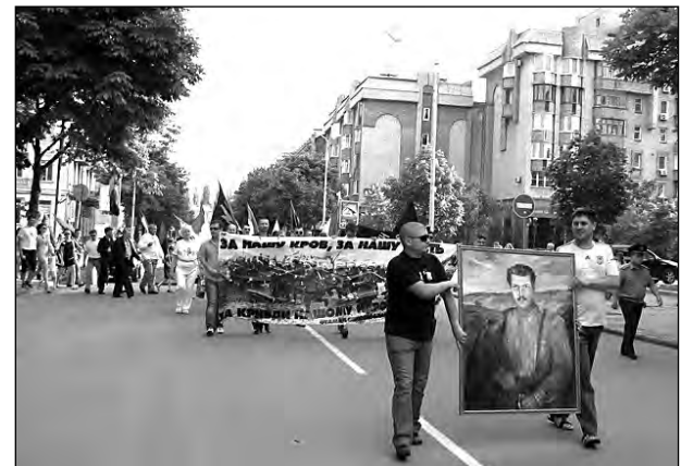
Учасники „Маршу національної гідності“ на вулицях Кривого Рогу.

Учасники події провели „Марш національної гідності“, пройшовши урочистою колоною до пам'ятника Тарасові Шевченкові, де поклали квіти до його підніжжя.