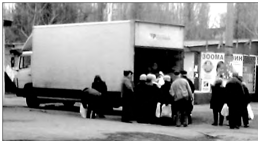
Автосміттевоз доставив передвиборні подарунки від партії „Родина“.