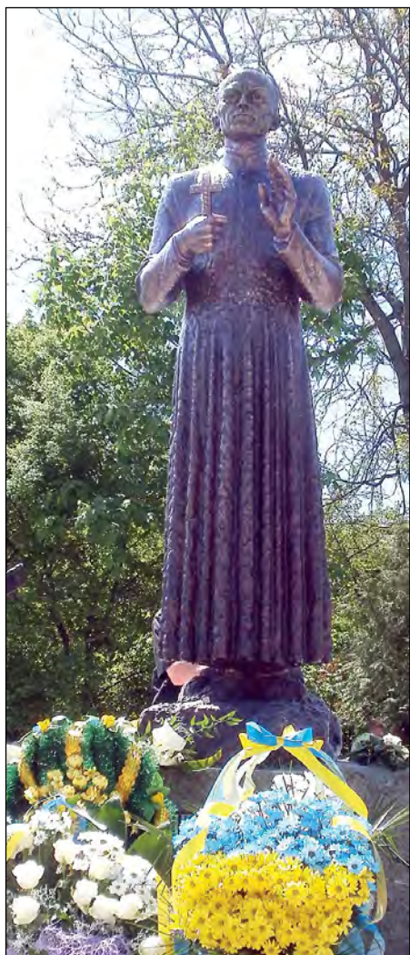
Пам'ятник о. Омелянові Ковчові у Перемишлянах.