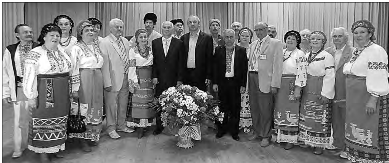
Хор „Запорозькі козаки“ в Івано-Франківському національному технічному університеті нафти і газу.

Далі хор відвідав древній Галич. У Народному домі у виконанні учасників хору звучали українські народні, козацькі, стрілецькі пісні, гуморески Павла Глазового та Павла Чубенка. Учасники