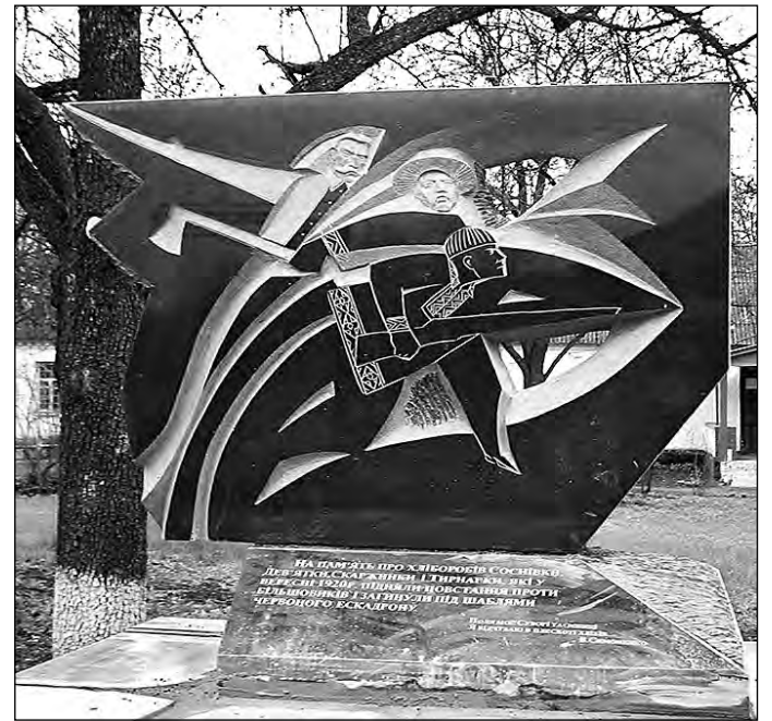
Пам'ятник загиблим в 1920 році селянам в селі Соснівка Кіровоградської області.

В той же день відбулося покладання квітів до пам'ятника чорноліському отаманові Пилипові Хмарі в селі Цвітне.