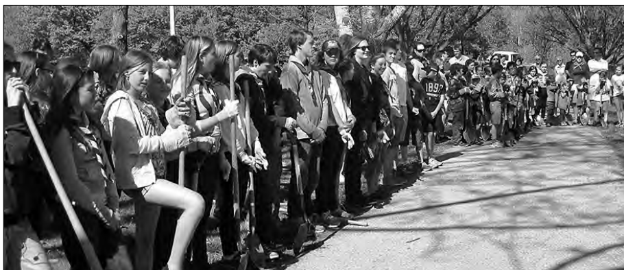
Багато пластуни прийшли саджати дерева в Торонто.