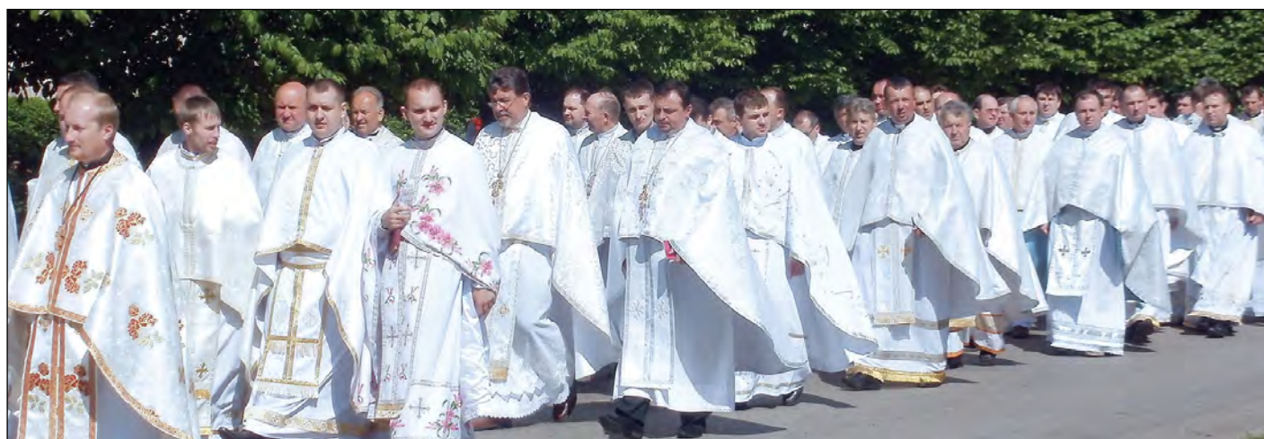
Процесія духовенства під час прощі на вшанування священномученика о. Омеляна Ковча.

На закінчення Літургії був зачитаний іспит сумління о. О. Ковча. Після Літургії учасники під спів дзвонів перейшли до пам'ятника О. Ковчові, який освятив Патріарх Святослав. Пам'ятник виготовлений з бронзи і має висоту 2.5 метра, автор – відомий скульптор Володимир Одрехівський.