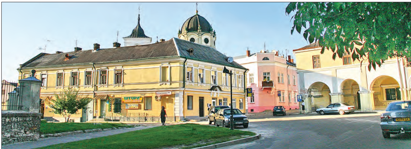
Центральна частина міста Жовкви.