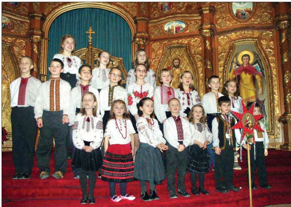
Дитячий хор при українській католицькій катедрі св. Йосафата.

У притворі катедрі відбулася збірка добровільних датків на допомогу сиротинцям в Україні. Про цей проект говорив о. Корнель Зубрицький під час програми. Зібрано 3,732 дол.