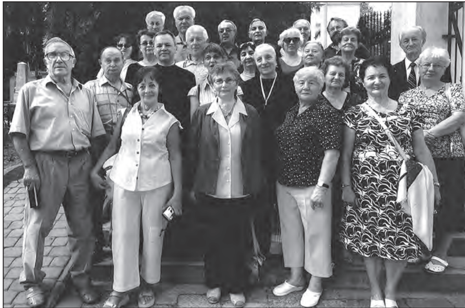
Учасники товариської зустрічі колишніх ліцеїстів в Перемишлі.

Упродовж трьох днів з'їзду його учасники відвідали місця, важливі для кожного українця. На військовому цвинтарі в Пикуличах поклали квіти, засвітили свічки воїнам, які боролися за волю, а в Млинах поклонилися композиторові о. Михайлові Вербицькому. Відвідали теж ярославську церкву, щоб помо-