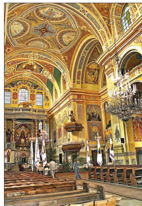
Костел св. Лаврентія в середині.

У Москві почали шукати іншої назви і перейменували місто на Нестеров – в пам'ять про летуна Петра Нестерова, який у Києві піднімав у небо літаки черкасів-братів Касяненків, Олександра Карпеки, здійснив кілька далеких летів, а також „петлю Нестерова“ – вер-