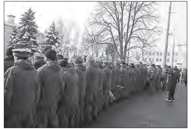
Ветерани-афганці 15 лютого в Києві повернулися до В. Януковича спинами.

Заступник голови правління Всеукраїнського громадського об'єднання „Ніхто, крім нас“