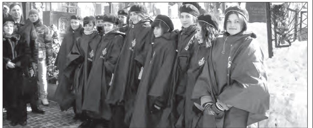
Пластовий курінь ім. Ольги Басараб.